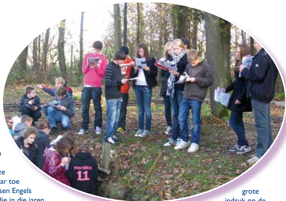
grote indruk op de leerlingen. In het 'Bay-

Op woensdag 18 en donderdag 19 november zijn 200 leerlingen uit 3 Havo en 3 Vwo in Ieper geweest om daar een druk programma af te werken. Het bezoek aan de Engelse begraafplaats Tyne Cot en het Duitse kerkhof Langemark maakt altijd een