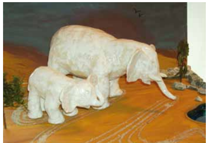
Werkstuk van Griselda van der Wiel 5 havo.